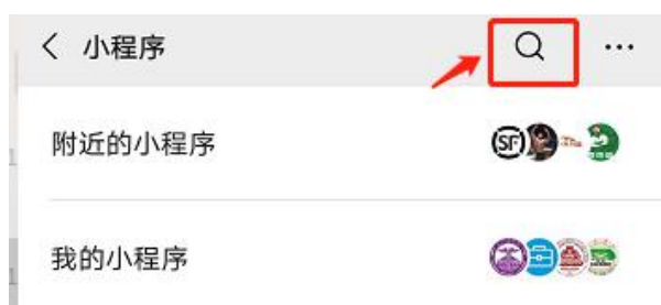
图 1 点搜索按钮