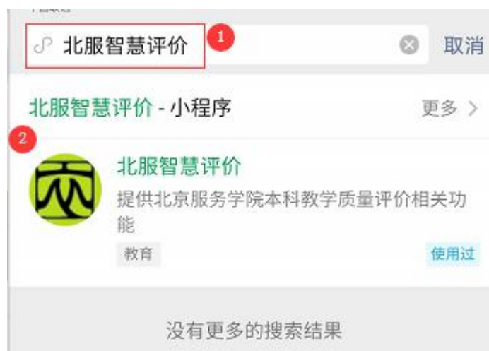
图 2 输入“北服智慧评价”搜索