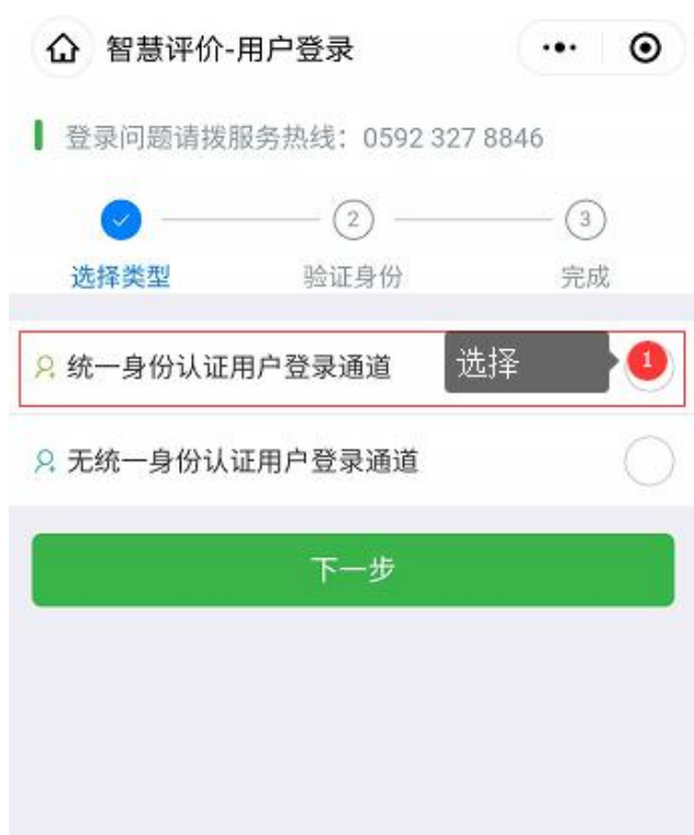
图3 选择统一身份认证